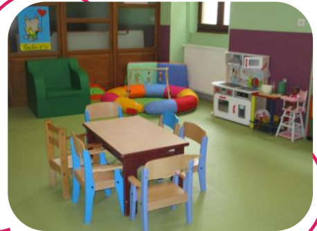
Atelier « Petite Enfance »