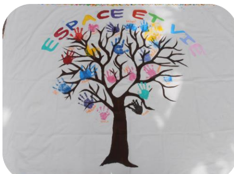
Atelier « Peinture mains d'enfants »