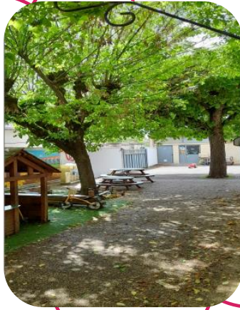
Espace détente de l'établissement