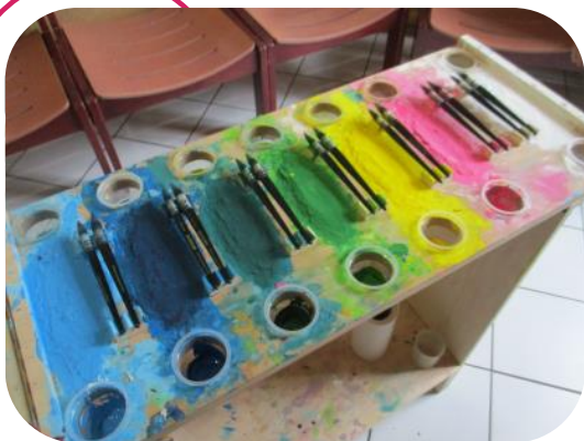
Atelier « Pigment »