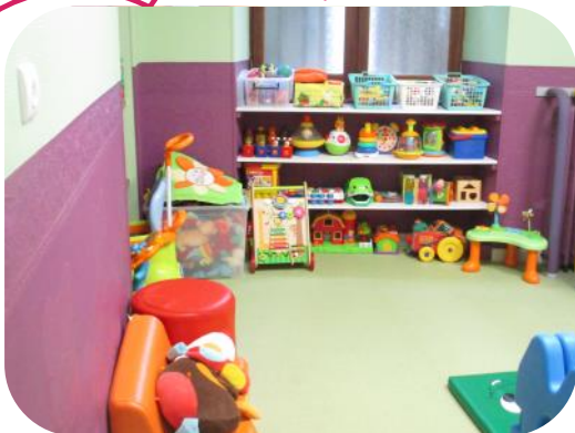
Atelier « Petite Enfance »