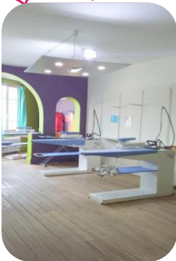
Atelier repassage du Fil de S.O.I.E.