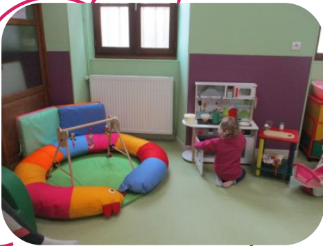
Atelier « Petite Enfance »