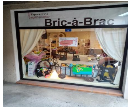
Coin brocante du Fil de S.O.I.E.