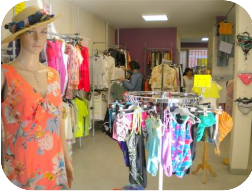
Espace friperie du Fil de S.O.I.E.